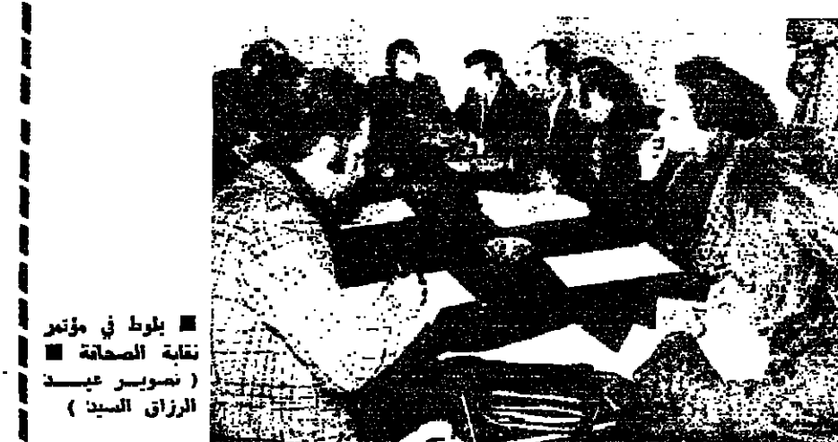
بلوط في مؤتمر نقابة الصحابة ( تصوير عيسى الزراق السيد )

١ - ايجاد فرص عمل في المجال امام افراد الهيئة التعليمية لتجديد تنوعياتهم في صندوق القروض ، ولكذلك بالنسبة للمعلمين غير المتقنين نتيجة الظروف على غاية مهنة التدريس ، وذلك بصورة مستقلة وفرادى . ٢ - صرف الصحوة للقرية العامة من ٧٥ و ٧٦ لتتمكن القرية من النهوض بالايعام التي تقع على عاتقها . ٣ - اقامة علاقة بوية مع الاهالي ، لخدمة مشاكلهم عن قرب ، ومناقشتهم في طرق حلها . ٤ - تدريب بعض الاهالي على عدد من المهارات التقنية . ٥ - تشجيع اقامة تعاونيات سكنية وزراعية ، واستيعابها . ٦ - ايجاد نموذج اتفاني يمكن استخدامه في قرى ومناطق اخرى . ٧ - الاهداف التفصيلية : ١ - اولا - الناحية السكنية : ١ - المساعدة على تحسين وضع المسكن الموجودة . ٢ - تقديم نصائح لاسكان جديدة تبسدا صغيرة ( مطبخ ، حمام ، غرفة نوم ) مع امكانية التوسع حسب تخطيط مسبق . ٣ - مساعدة الاهالي في البناء ، بواسطة مخيمات عمل تطوعية . ٤ - العمل على ايجاد وتطوير اساليب محاربة جديدة تناسب مع امكانيات المنطقة . ٥ - اقامة تطوير العمل في تصميم واثناء محاميات سكنية ( من خلال تعاونيات ) . ٦ - تالنا - الناحية الزراعية : ١ - ارشاد حول طرق تحسين الانتاج الزراعي